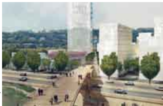
© Herzog & de Meuron - MDP

de commerces se construit jusqu'au printemps 2011 et en parallèle, la deuxième tranche de la phase 1 se poursuit vers le nord. Sept programmes sont lancés. Comprenant bâtiments basse consommation, logements (dont 50 % sociaux), bureaux - notamment le futur siège de la Banque de France - et groupe scolaire, ils seront livrés entre 2011 et 2012. Au sud, la réhabilitation du port Rambaud continue avec la construction de sièges de grandes entreprises et, à plus long terme, l'installation d'un hôtel haut de gamme. ■